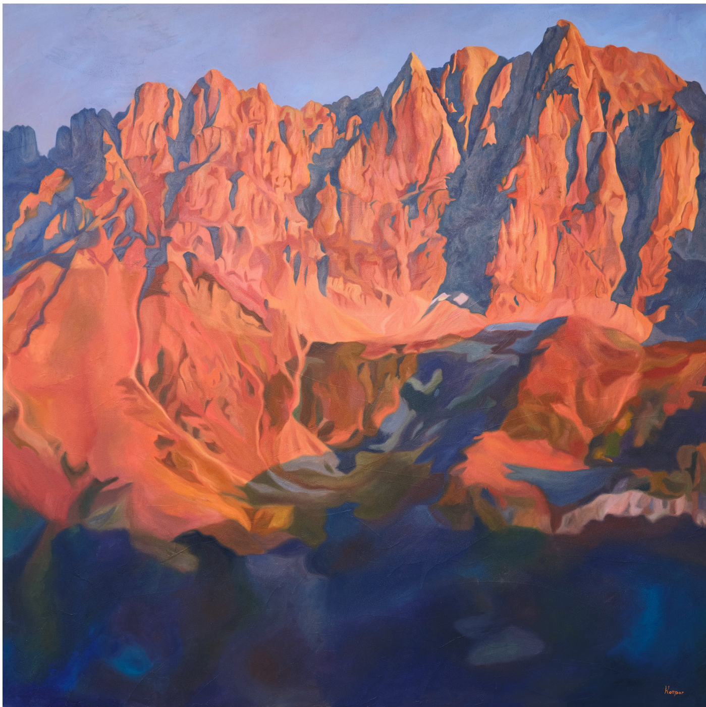
Der Wilder Kaiser (No. 1/36) Serie: 36 Stimmungen des Wilden Kaisers

Jahr: 2024 Medium: Öl auf Leinwand Maße: 180 × 180 cm